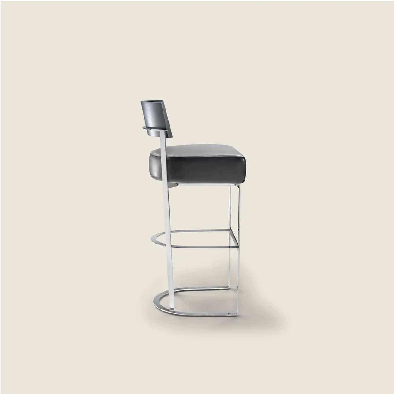
MORGAN ANTONIO CITTERIO 2002 TABOURETS