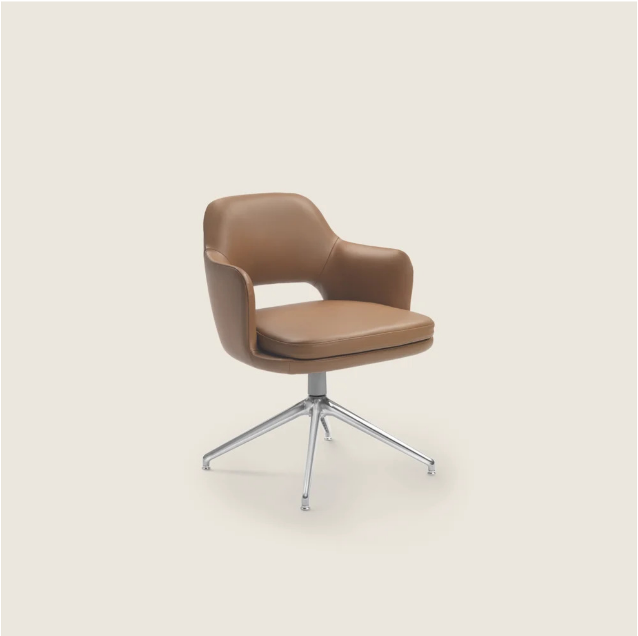
ELISEO ANTONIO CITTERIO 2022 ARMLEHNSTÜHLE/STÜHLE