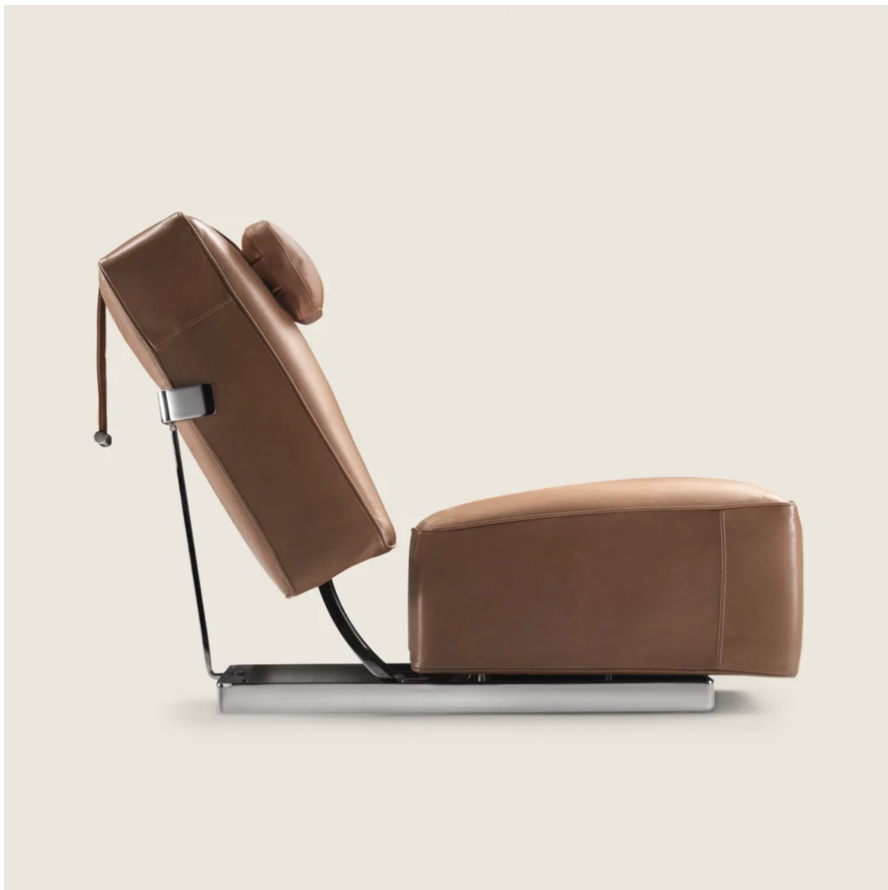
A.B.C.D. ANTONIO CITTERIO 2014 SILLONES