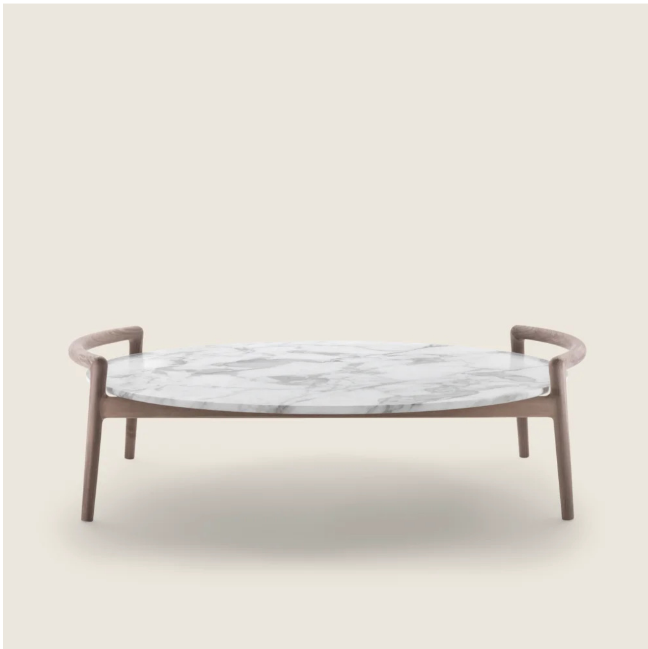
ASCANIO ANTONIO CITTERIO 2018 MESAS DE CENTRO