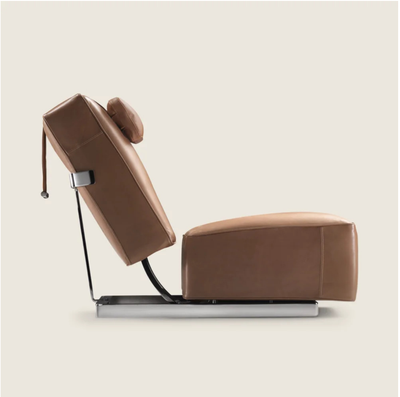
A.B.C.D. ANTONIO CITTERIO 2014 POLTRONE