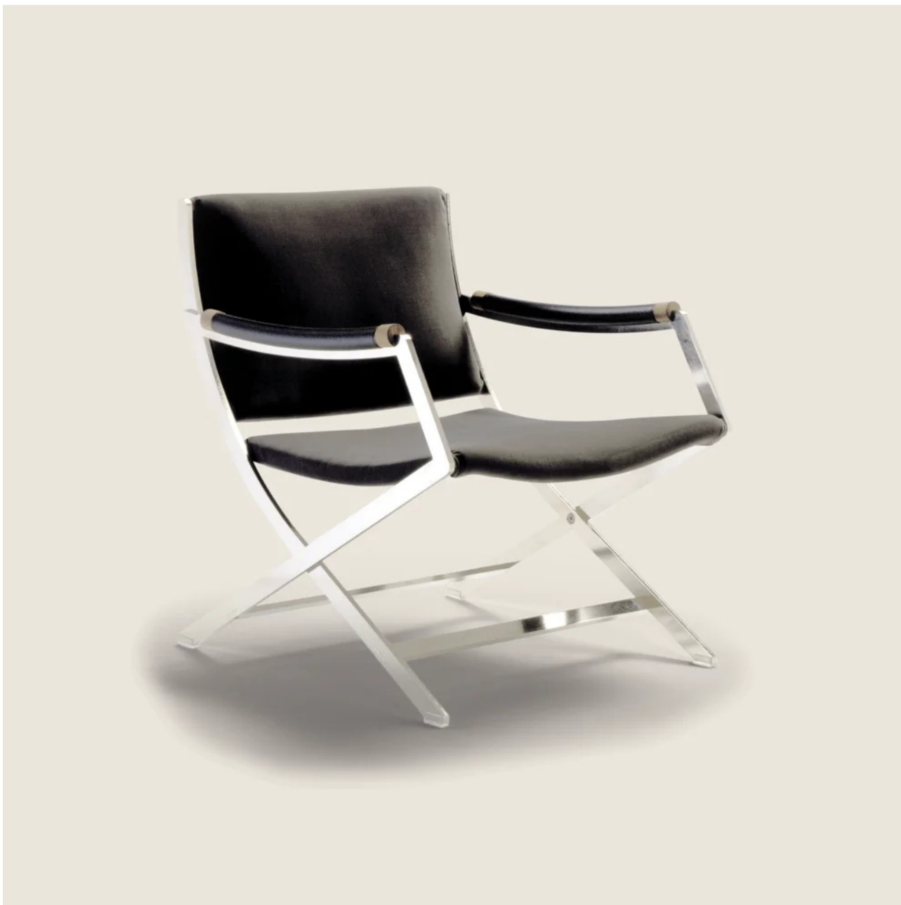
PAUL ANTONIO CITTERIO 2006 POLTRONE