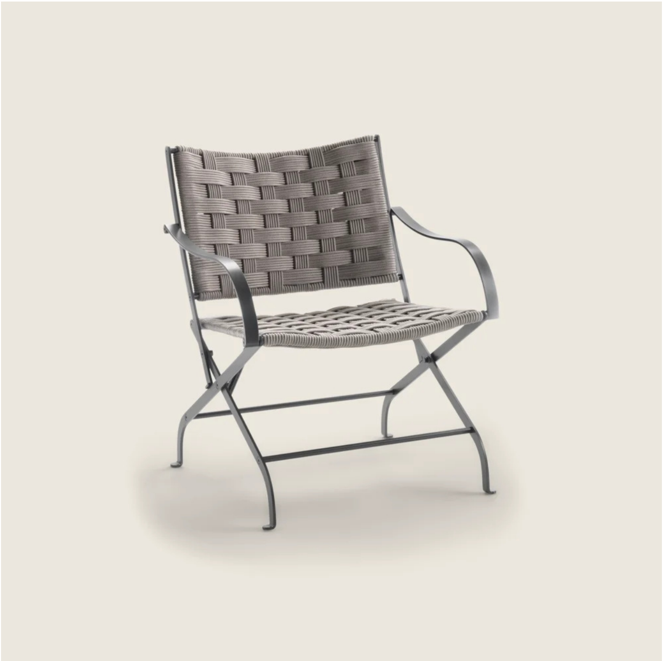
CARLOTTA OUTDOOR ANTONIO CITTERIO 2020 SILLONES