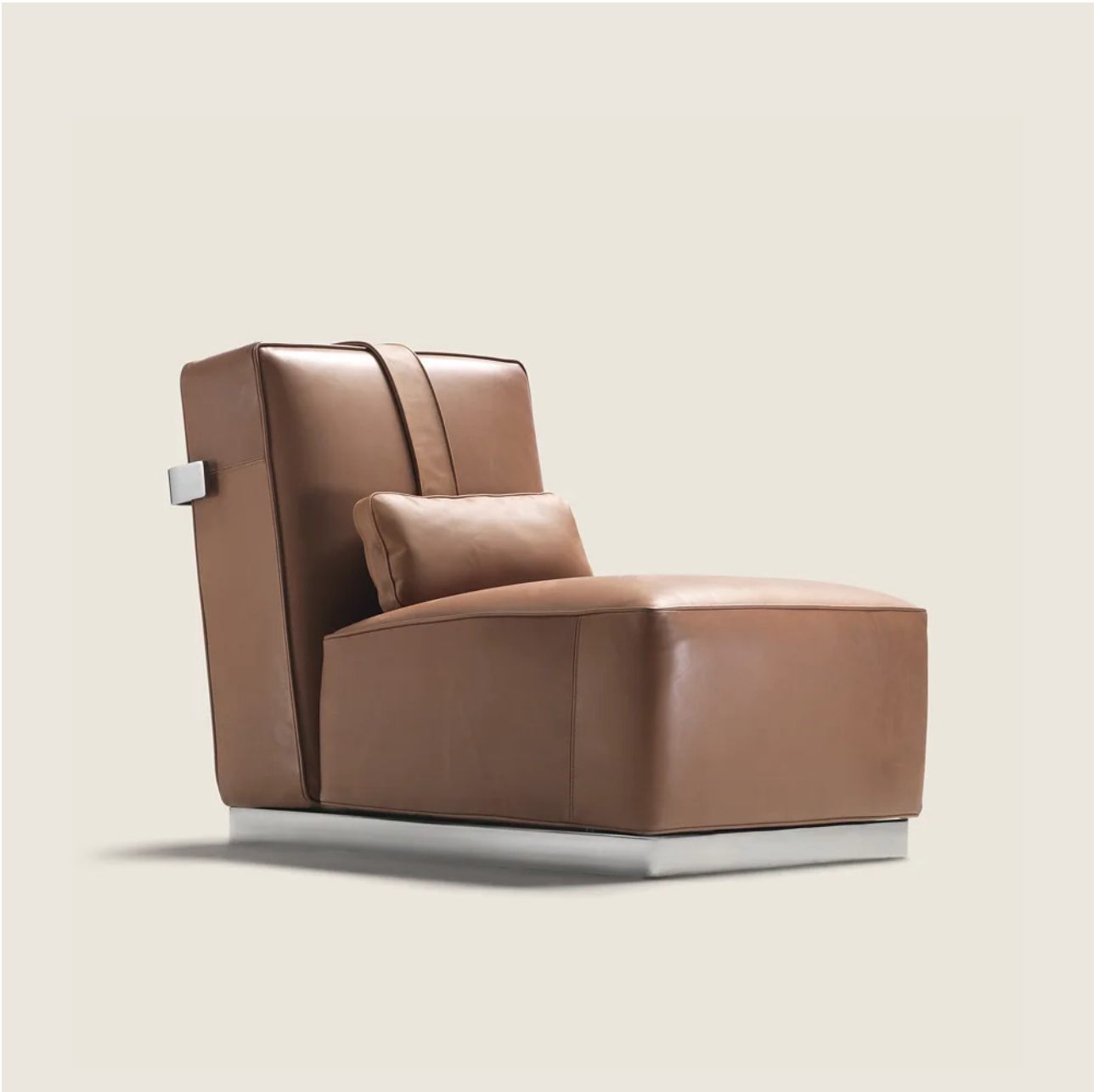
A.B.C.D. ANTONIO CITTERIO 2014 SILLONES