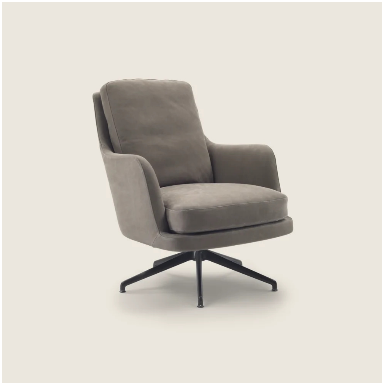
MARLEY ANTONIO CITTERIO 2021 POLTRONE