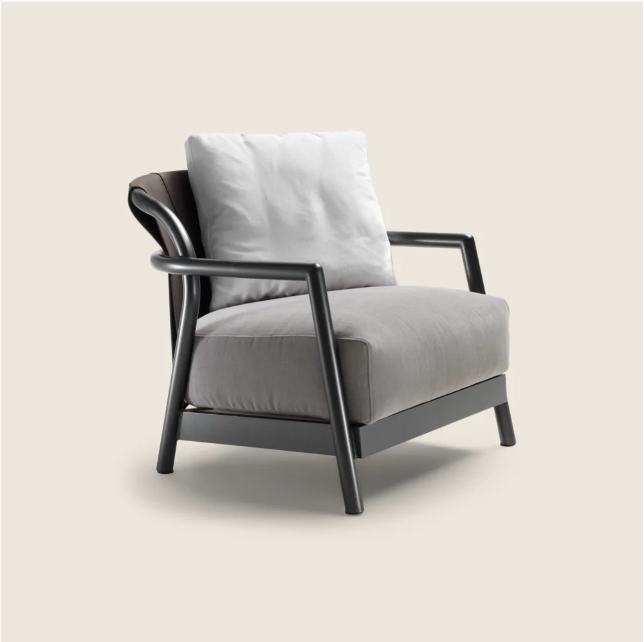
ALISON OUTDOOR CARLO COLOMBO 2019 FAUTEUILS