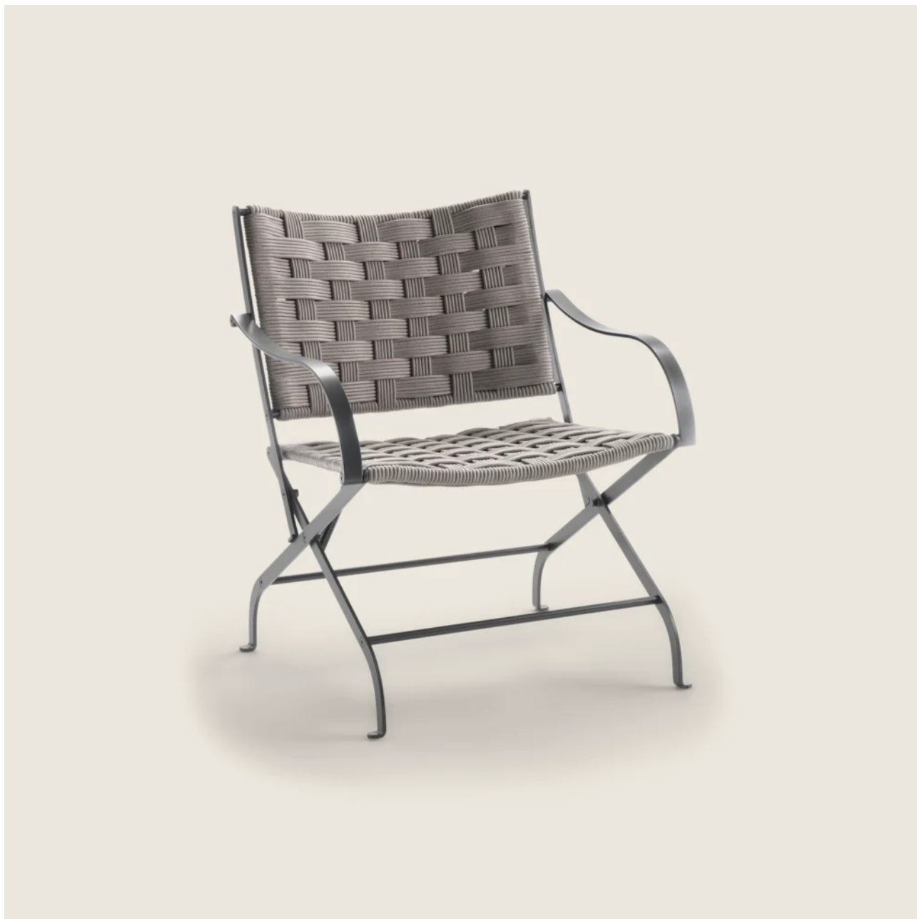
CARLOTTA OUTDOOR ANTONIO CITTERIO 2020 FAUTEUILS