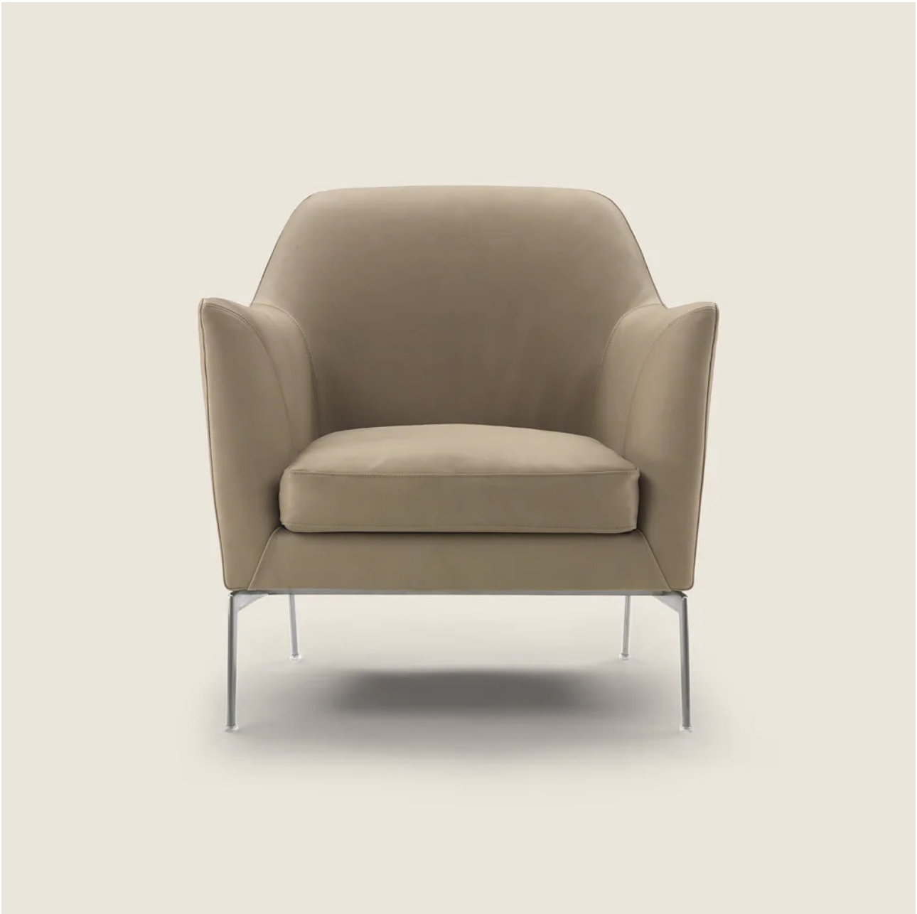
LUCE ANTONIO CITTERIO 2015 FAUTEUILS