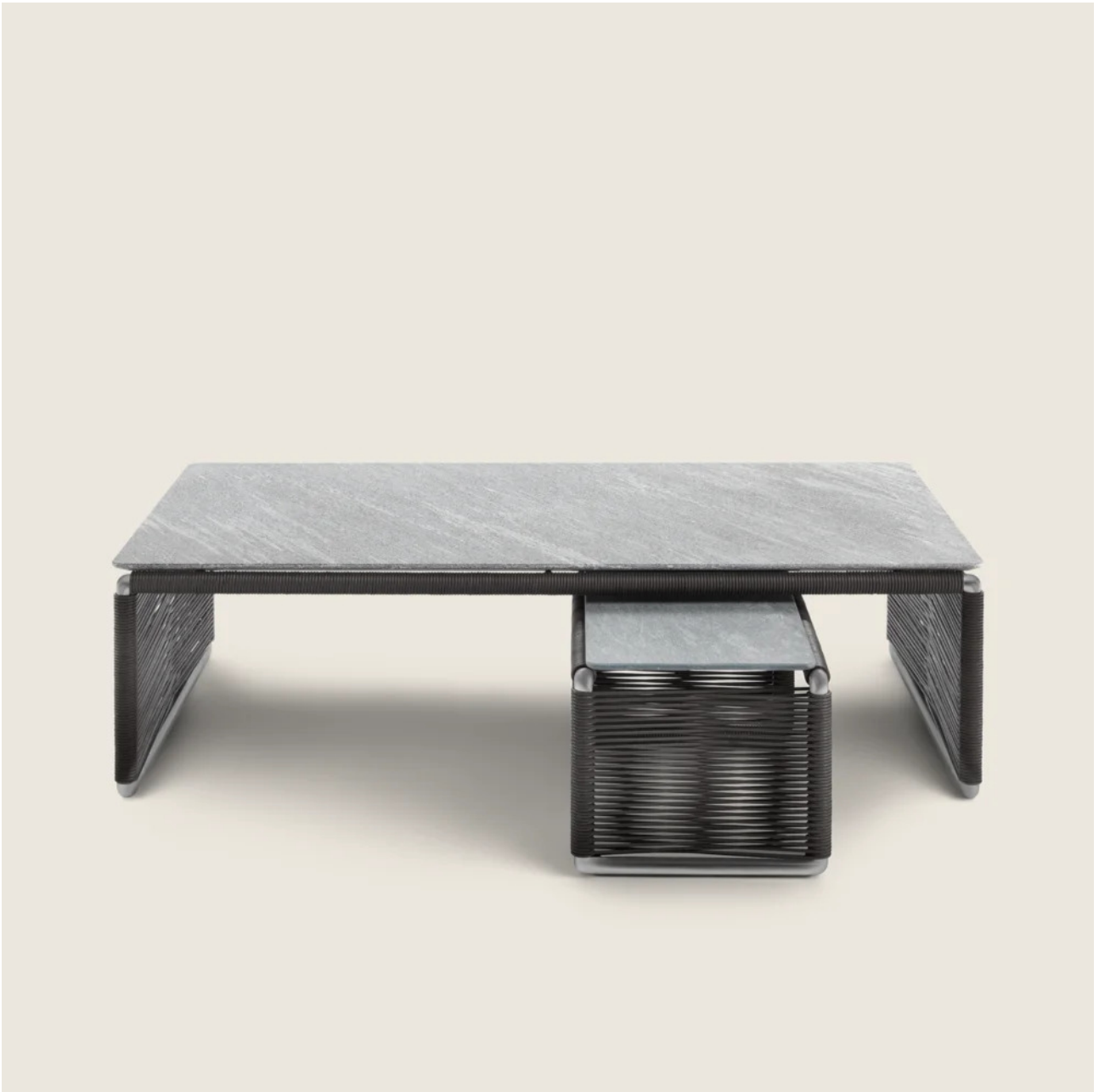
TINDARI OUTDOOR ANTONIO CITTERIO 2019 MESAS DE CENTRO