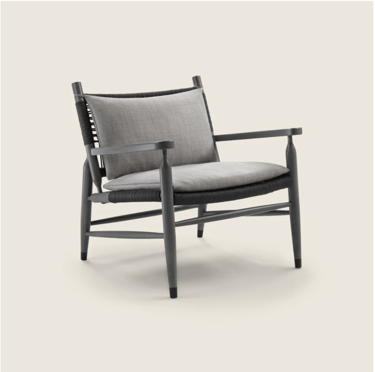
TESSA OUTDOOR ANTONIO CITTERIO 2020 FAUTEUILS