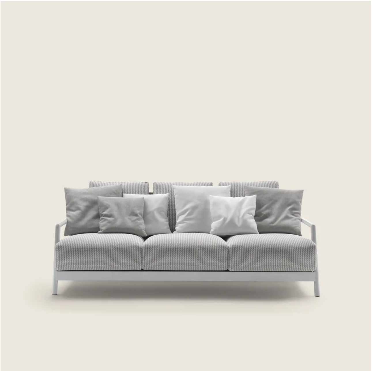
CARLO COLOMBO 2019