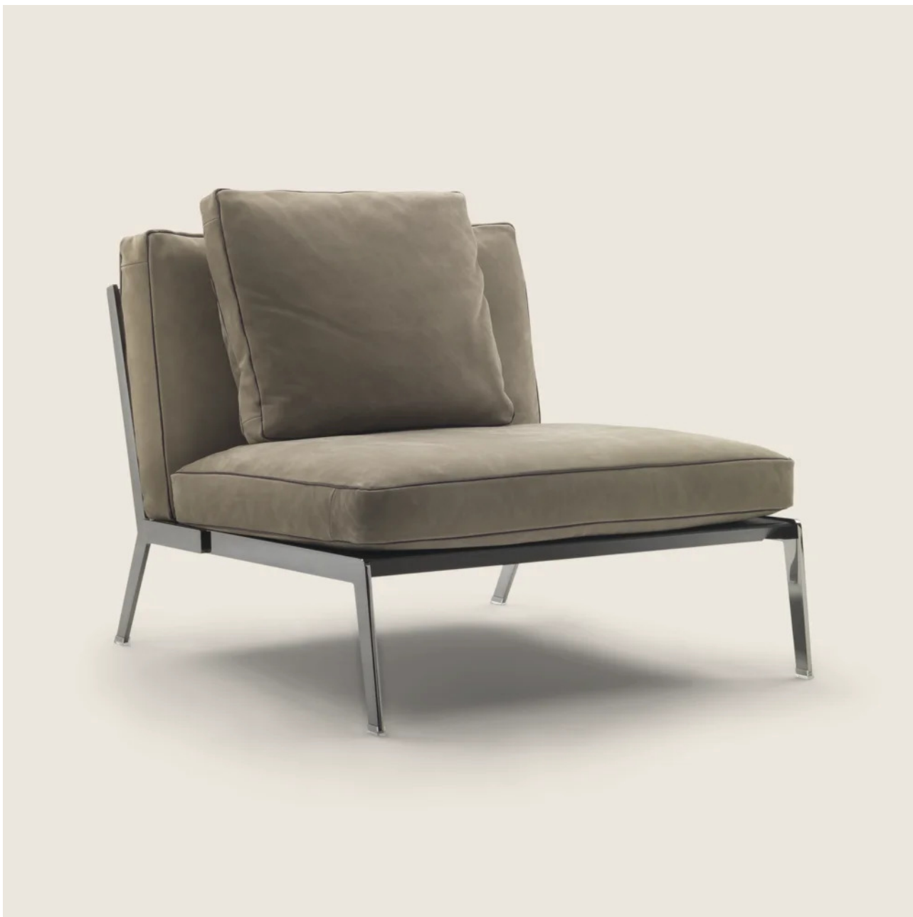
ANTONIO CITTERIO 2005