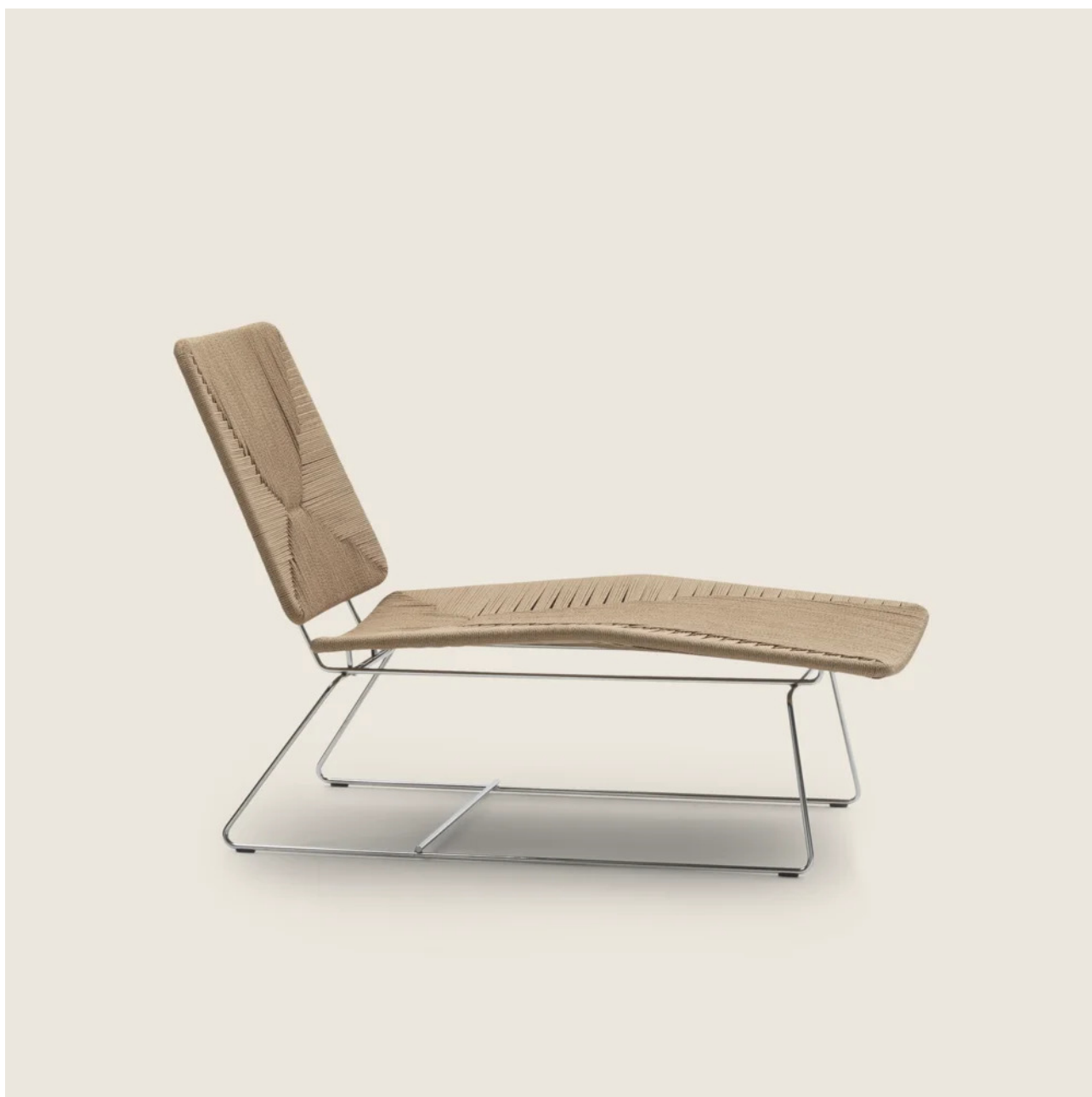
ECHOES | ECHOES S.H. CHRISTOPHE PILLET 2021 CHAISE LONGUE/DORMEUSE