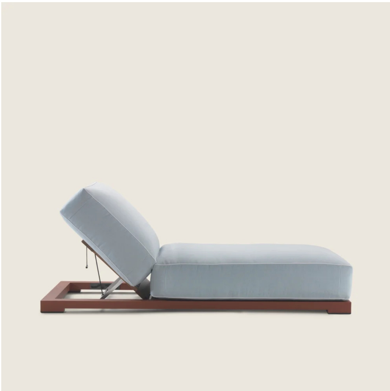
MILOS ANTONIO CITTERIO 2023 DAYBED