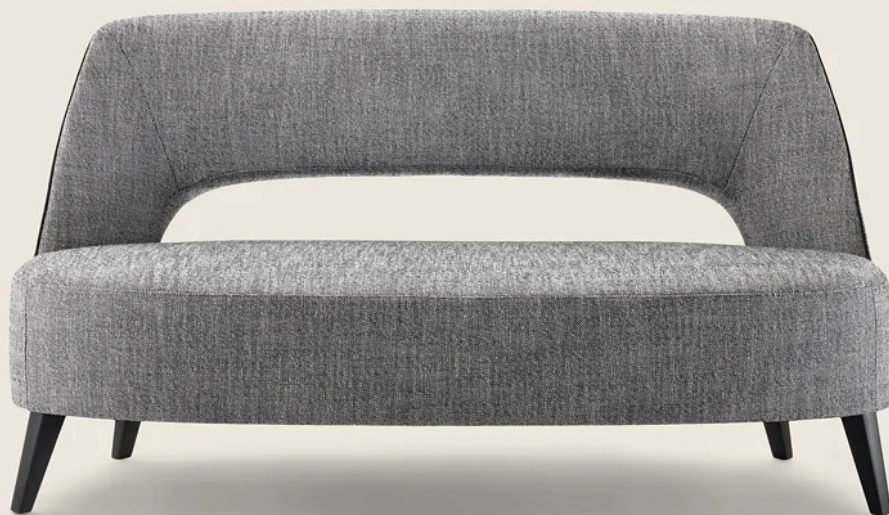
ERMIONE ROBERTO LAZZERONI 2015 CANAPÉS