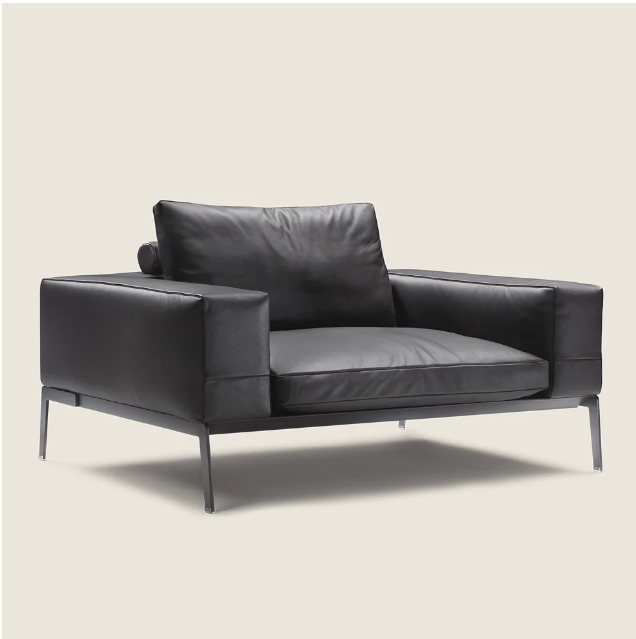
LIFESTEEL ANTONIO CITTERIO 2006 POLTRONE