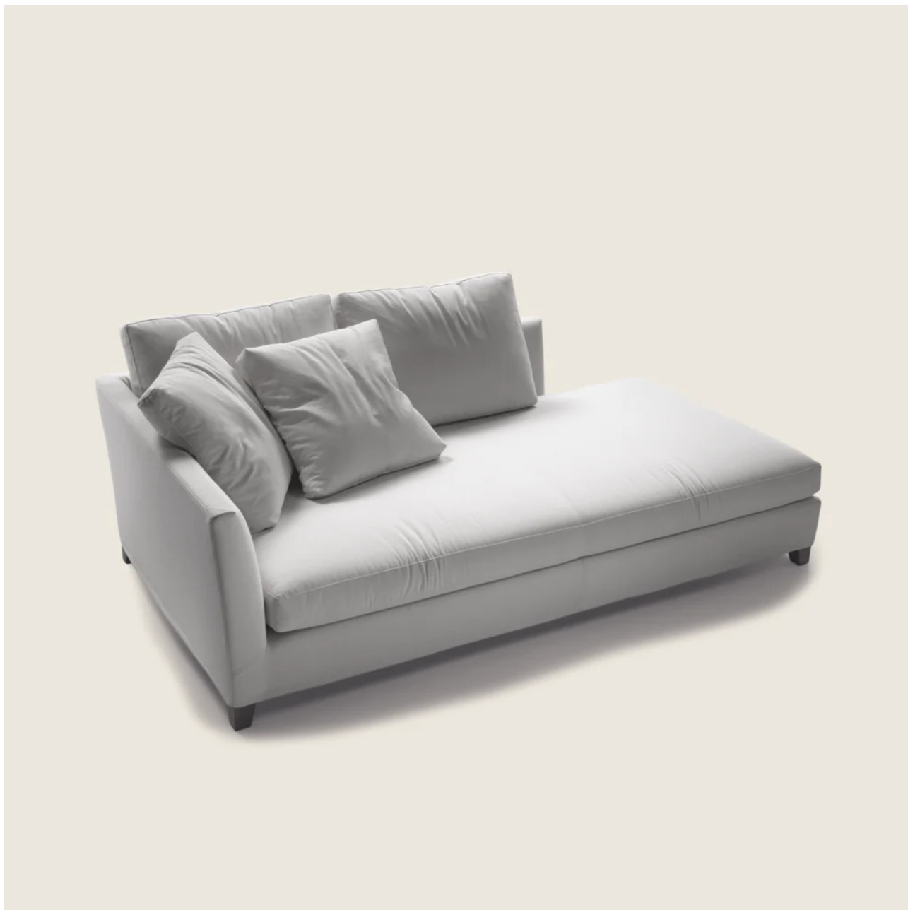
VICTOR DESIGN CENTER 1984 CHAISELONGUES/DORMEUSE