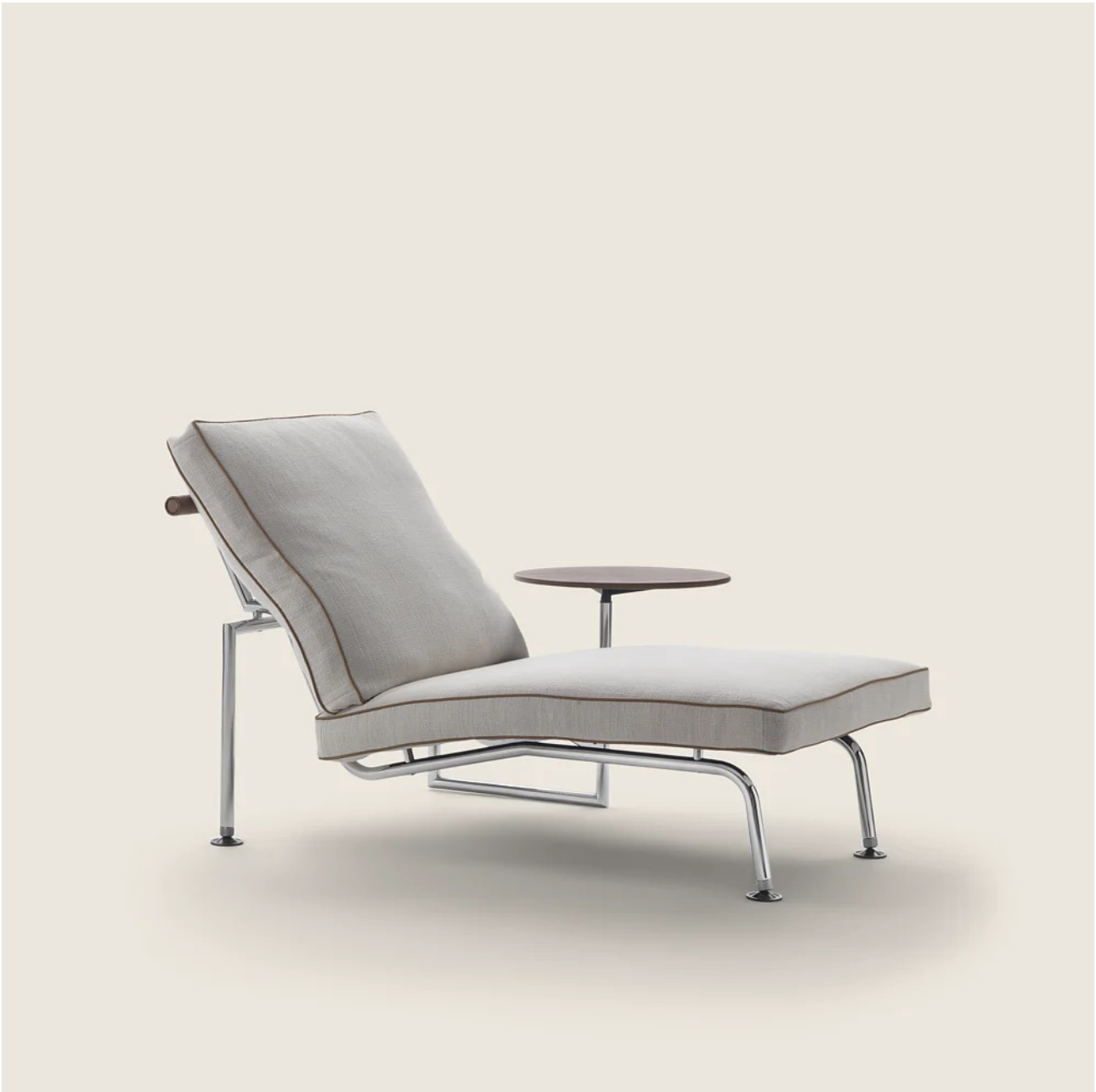
GINGER ANTONIO CITTERIO 1984 CHAISE LONGUE/DORMEUSE