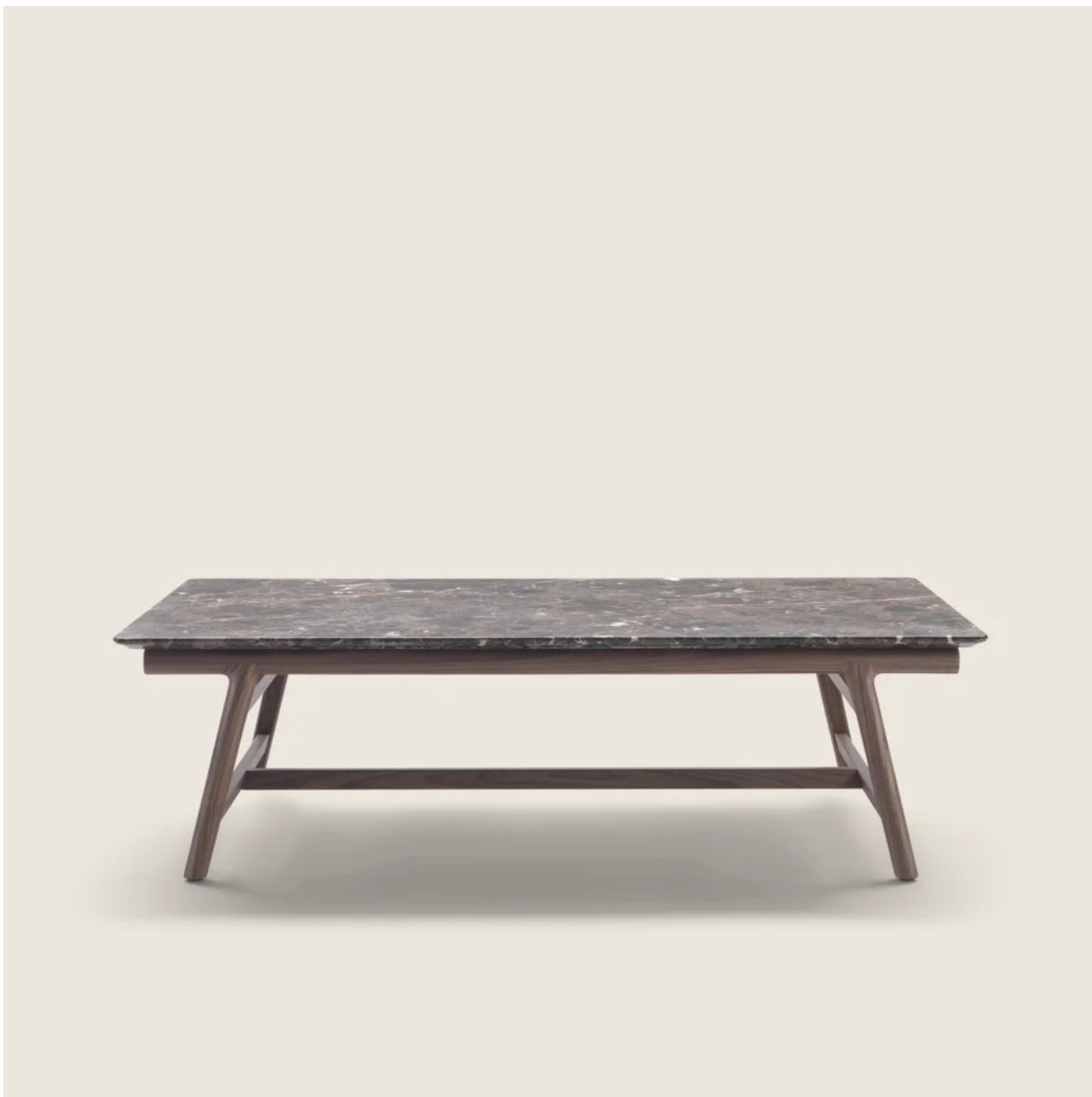
GIANO ANTONIO CITTERIO 2015 MESAS DE CENTRO