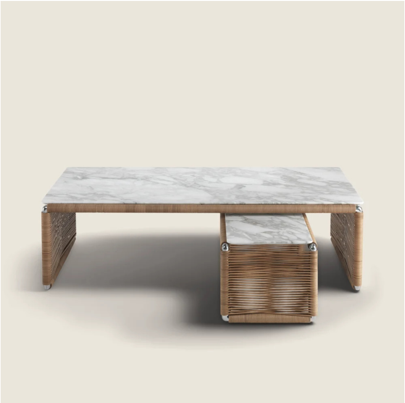
TINDARI ANTONIO CITTERIO 2015 MESAS DE CENTRO