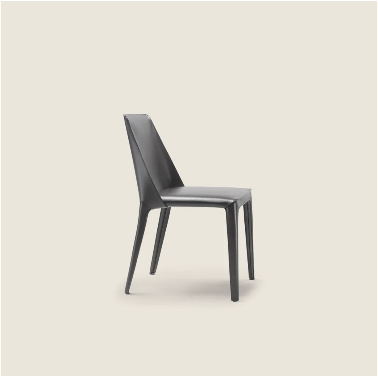
ISABEL CARLO COLOMBO 2013 ARMLEHNSTÜHLE/STÜHLE