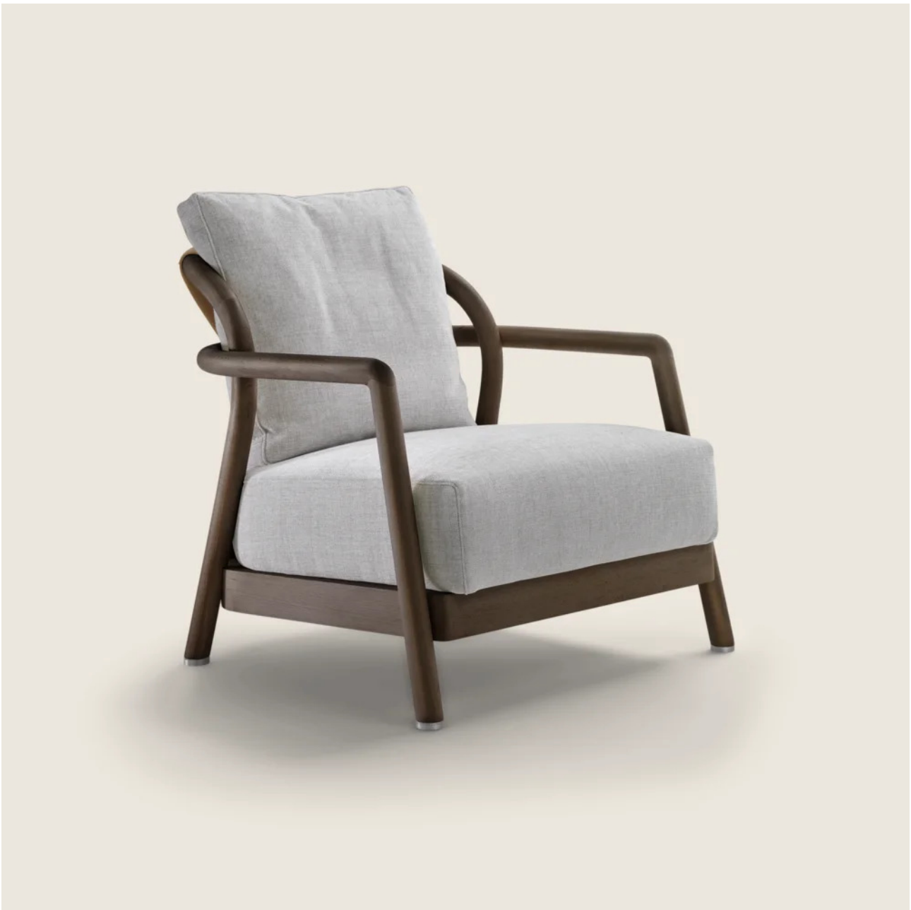
CARLO COLOMBO 2018