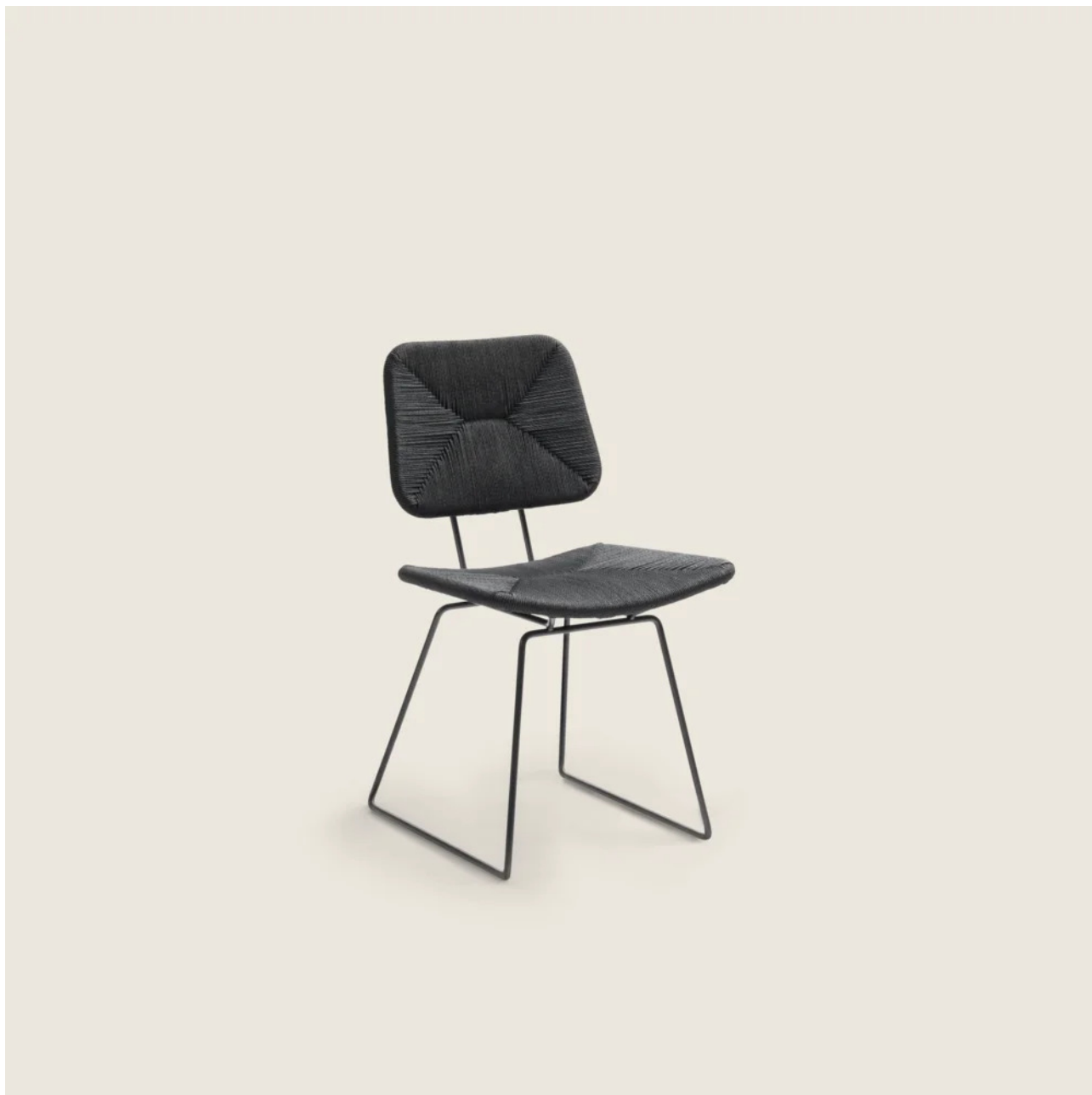
ECHOES OUTDOOR CHRISTOPHE PILLET 2020 ARMLEHNSTÜHLE/STÜHLE