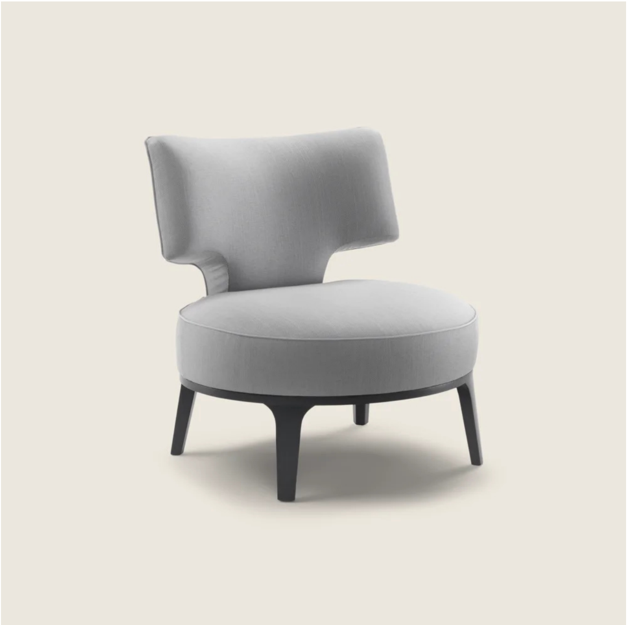
DROP ROBERTO LAZZERONI 2009 POLTRONE