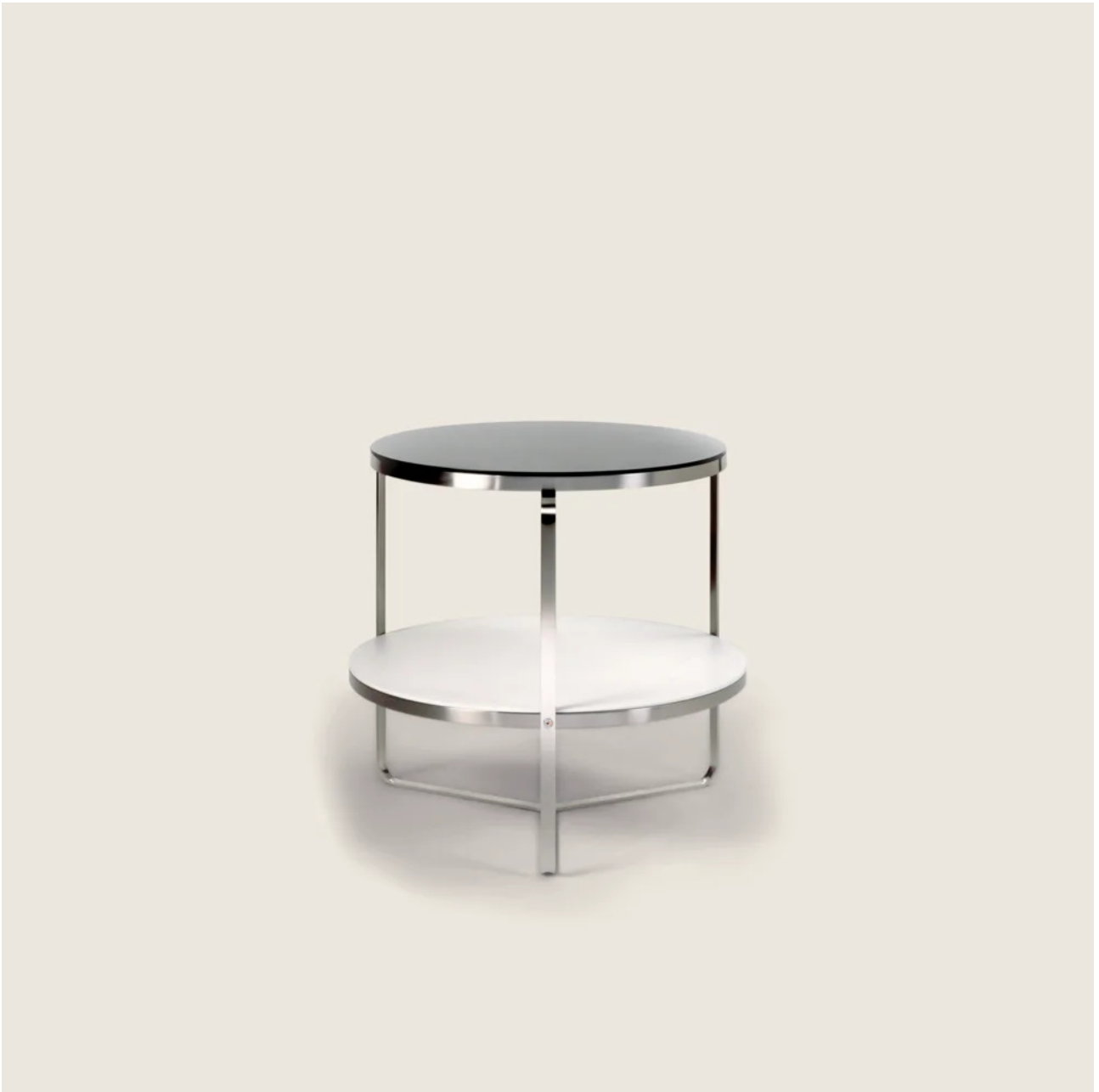
ANTONIO CITTERIO 1996