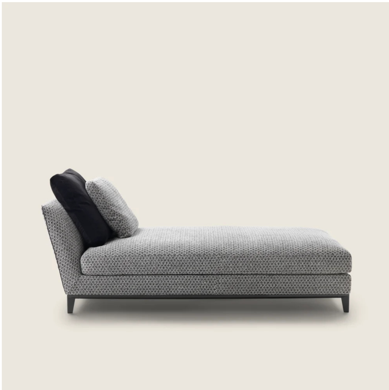
WESTON ROBERTO LAZZERONI 2020 CHAISELONGUES/DORMEUSE