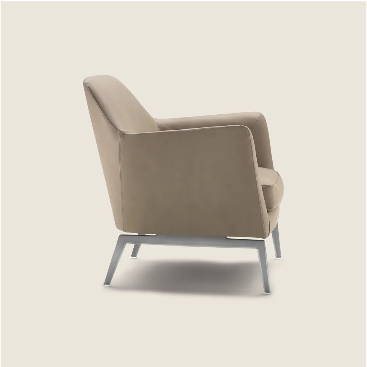
LUCE ANTONIO CITTERIO 2015 FAUTEUILS