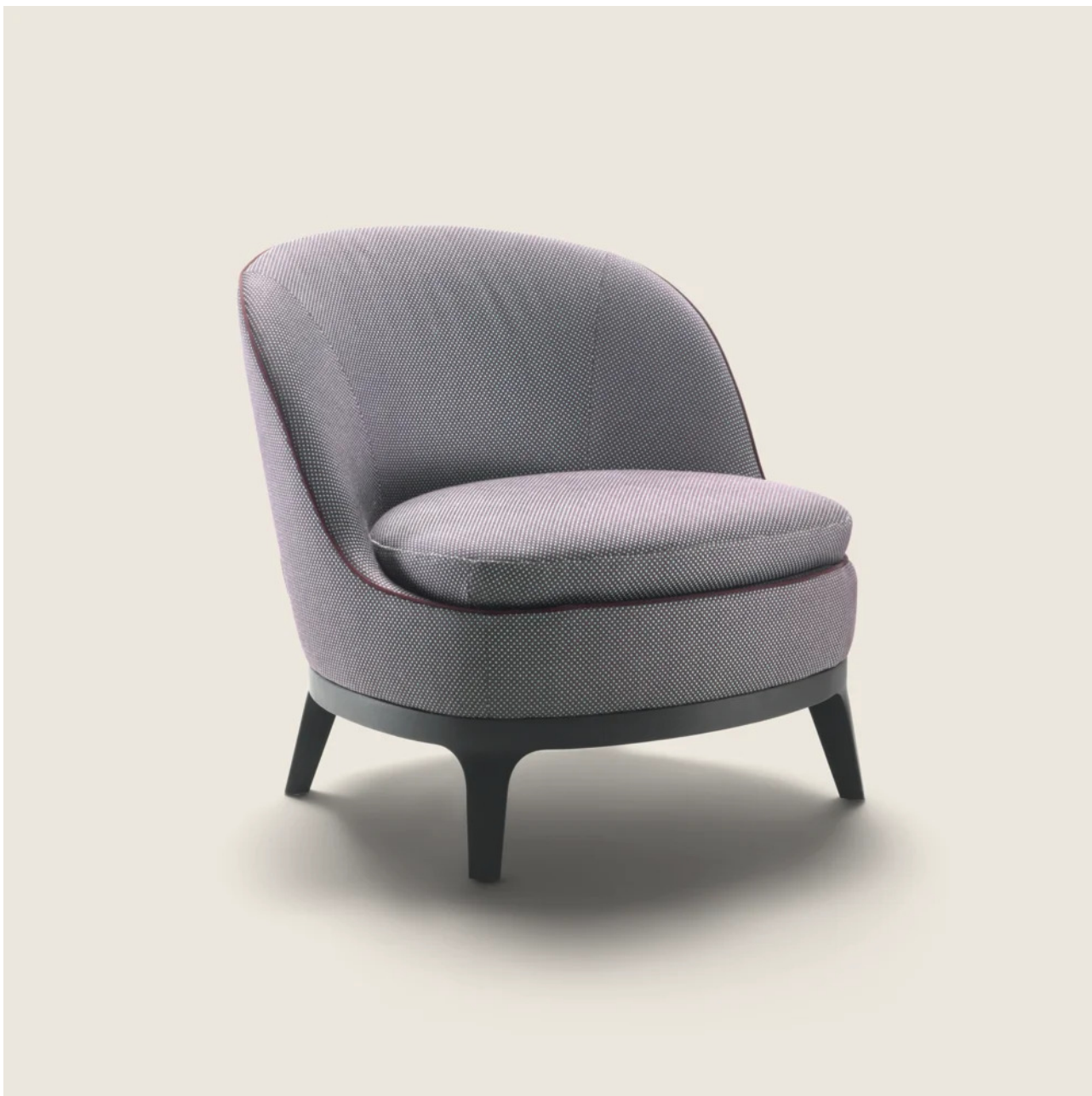
DRAGONFLY ROBERTO LAZZERONI 2017 FAUTEUILS