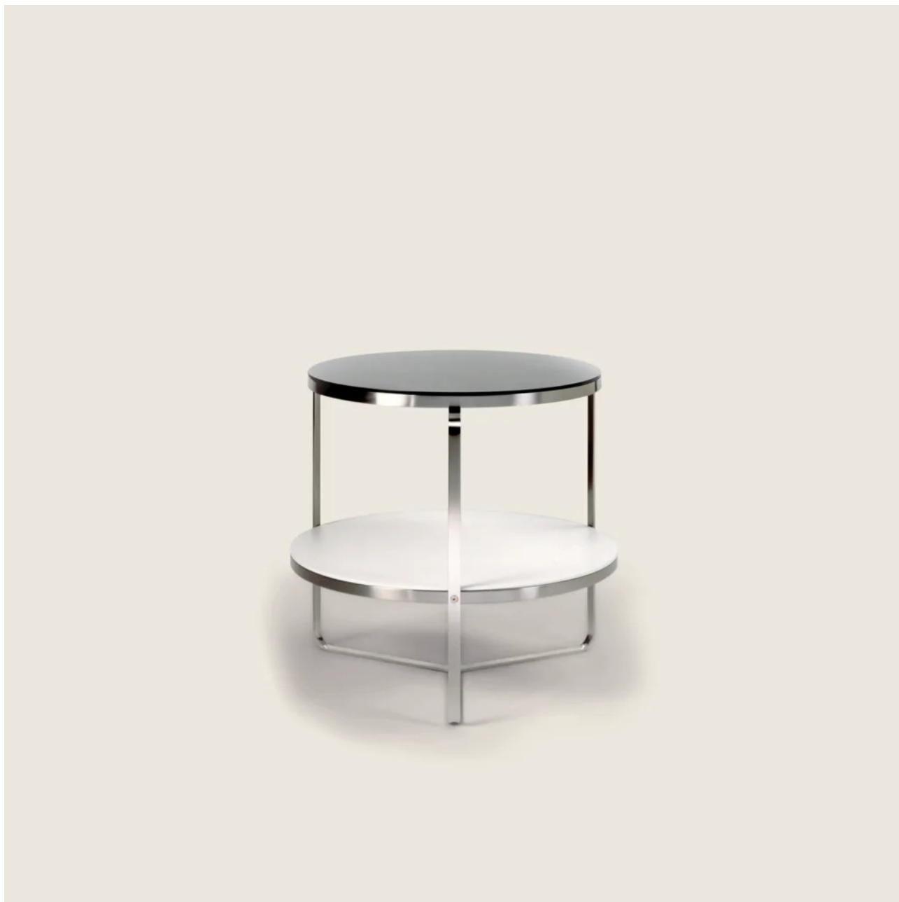
CARLOTTA ANTONIO CITTERIO 1996 MESAS DE CENTRO