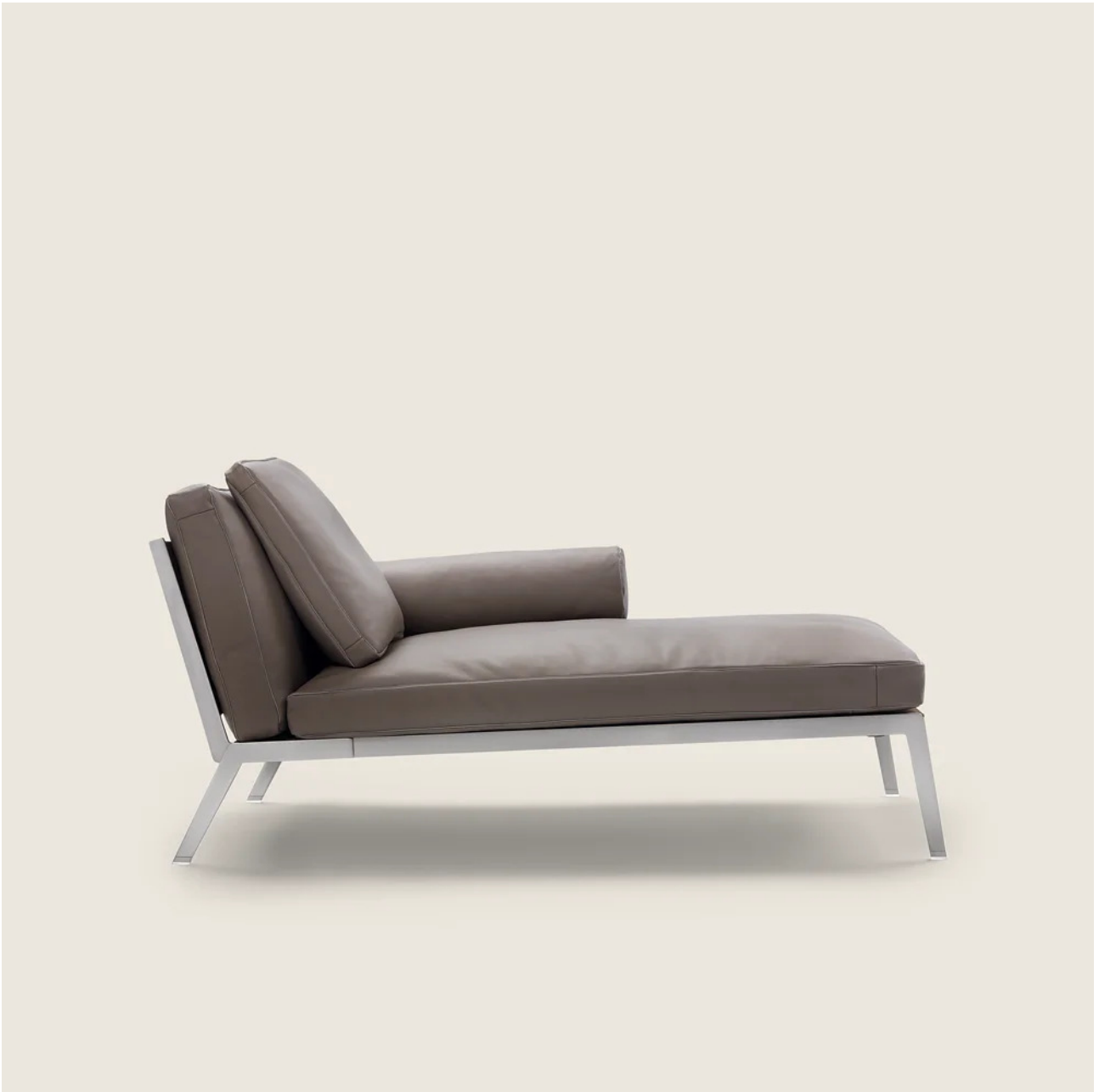
HAPPY ANTONIO CITTERIO 2005 CHAISELONGUES/DORMEUSE